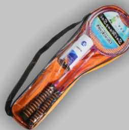
спорт и отдых