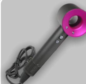
красота и здоровье